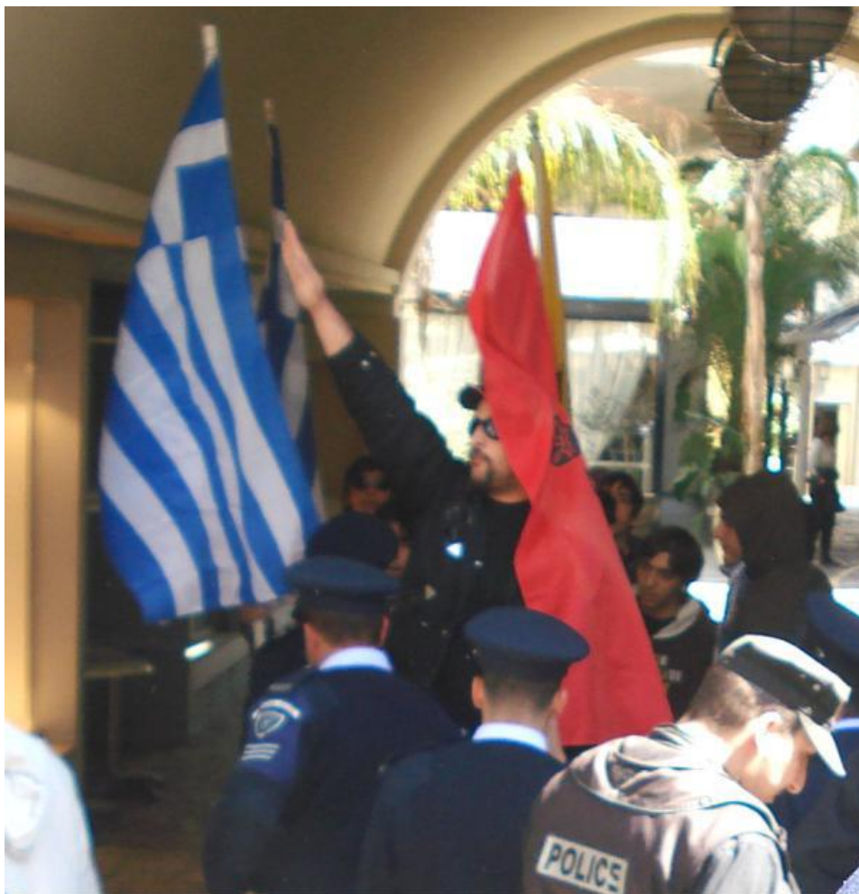
Μέλος της Χρυσής Αυγής (Πυρήνας Κύπρου) χαιρετά ναζιστικά την ημέρα ανοίγματος του οδοφράγματος της Λήδρας στην Λευκωσία τον Μάρτη του 2007.